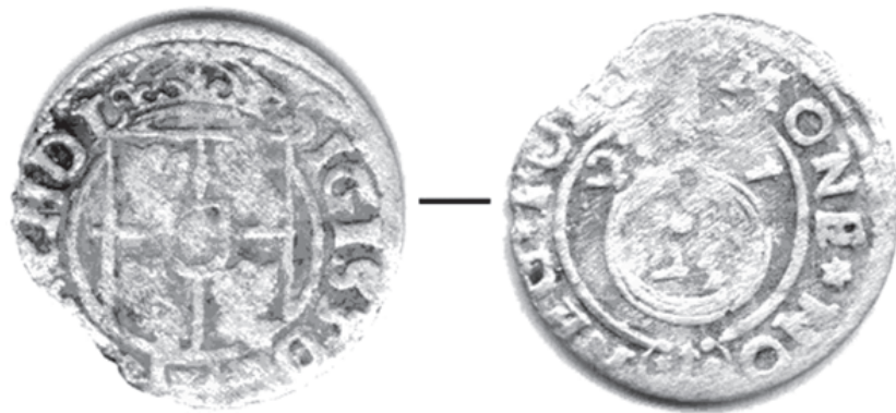
Рис. 3. Попелі. Монета (півторак коронний, 1622 р., Річ Посполита)

Датувати пам'ятку допомагає також монета (рис. 3), виявлена 2012 р. в центральній частині майданчика городища. Це коронний півторак, викарбований 1622 р. в Бидгощі, в часи правління короля Зигмунта III Ваза. На аверсі монети зображено п'ятиполий герб, під яким в щиті – 3, а навколо напис: SIGIS D G – REX P M D L. На реверсі – держава, всередині якої – 24, а по боках, між хрестом: 2 – 2. Під державою, в незакритому щиті, знак «Вадвич», а навколо напис: *MONE*NO – REG•POLO+. Діаметр монети – 19,2 мм, вага – 0,74 г 20 .