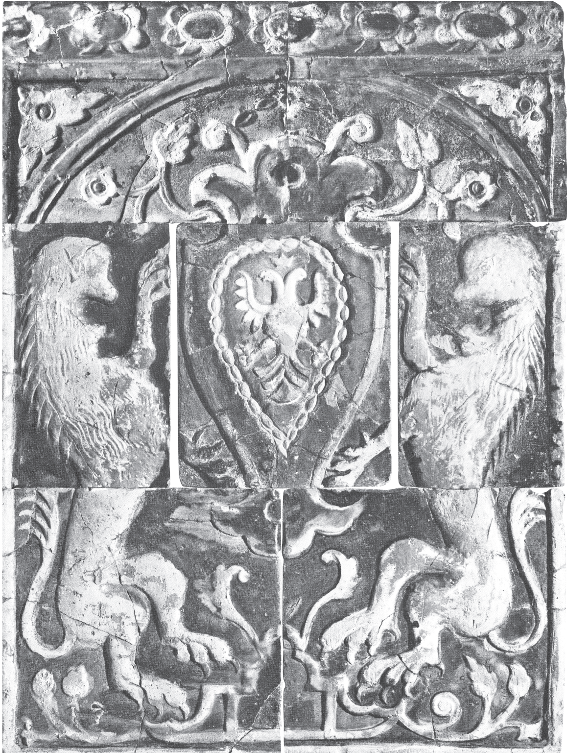
Рис. 2. Попелі. Геральдична композиція з кахлів із зображенням герба Перемишльської землі (за Г. Івашків, 2010)

На території монастирища П. Лінинський зібрав представницьку колекцію кахлів, датованих XVI–XVII ст. 18 Вони розписані різнокольоровими емальми, ангобами і